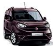
590 Bordowy Montalcino (metalizowany)