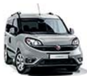
612 Szary Maestro (metalizowany)