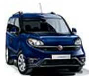
487 Granatowy Mediterraneo (metalizowany)