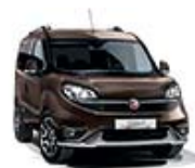
444 Brązowy Magnetico (metalizowany) tylko dla wersji Trekking