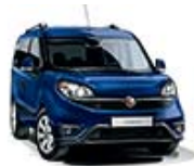
479 Granatowy Riviera (pastelowy)