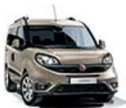
261 Beżowy Spumante (metalizowany)