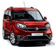
168 Czerwony Passione (pastelowy)