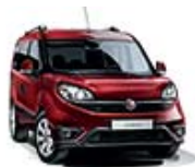
293 Czerwony Amore (metalizowany)