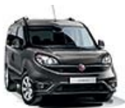
695 Szary Colosseo (metalizowany)