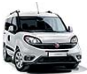
249 Biały Gelato (pastelowy)