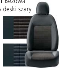
371 Beżowa Pas deski szary