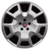
Kolpaki ochronne kół