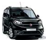
632 Czarny Tenore (metalizowany)