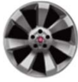
Obłęczce ze stopów lekkich 16"