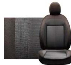
597 Brązowa Pas deski brązowy