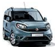
448 Niebieski Canalgrande (metalizowany)