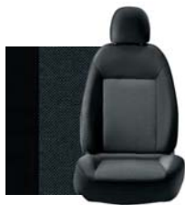
121 Szara Pas deski szary